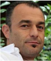
Metz Klaus Caritas, Netzwerk Lana.